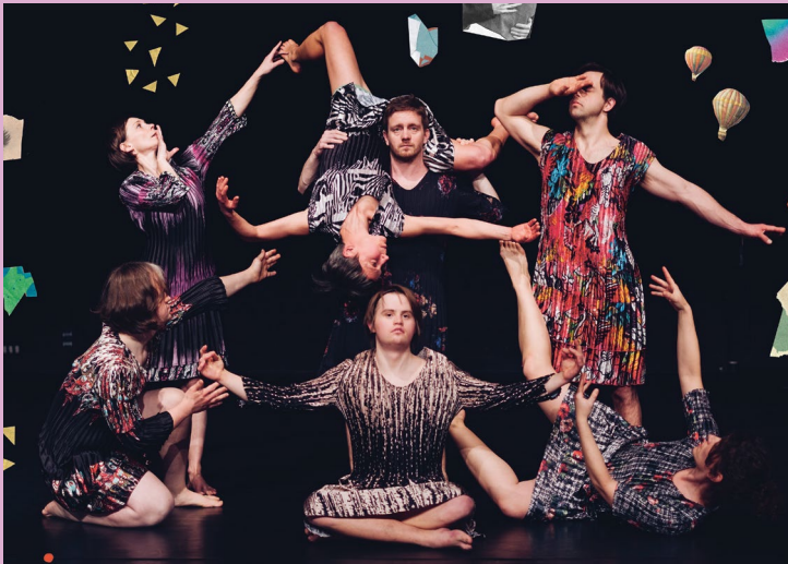
UNDRESSED von tanzbar_bremen

NO LIMITS – Disability & Performing Arts Festival Berlin ○ 13.-24. November 2024 ○ HAU Hebbel am Ufer, RambaZamba Theater, Theater Thikwa, Ballhaus Ost, Theater an der Parkaue ○ no-limits-festival.de