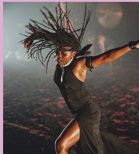
Transkontinentale: Kimpa Vita von DeLaVallet Bidiefono

○ FROZEN POWER von MUDA Africa ○ 5.-8. Dezember 2024 ○ Humboldt Forum ○ humboldtforum.org