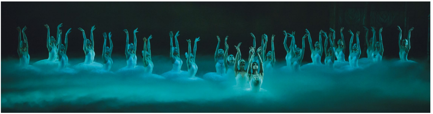
Staatsballett Berlin: Schwanensee . Choreografie und Inszenierung von Patrice Bart, Musik von Peter I. Tschaikowsky.

natur in diese Choreografie einzuschreiben wusste, verkörpern die Anmut des Sterbens mit Pathos. Als Kitsch wäre eher das Stillstellen der Bewegung, die Verdinglichung eines vermeintlich genuin Weiblichen in Objekten für Erwachsene zu verstehen – z. B. in Keramikfiguren. Dass das Publikum im späten 19. Jahrhundert beim Sterbenden Schwan an Kitsch durch zu viel Pathos gedacht hat, würde ich bezweifeln. Die Sehgewohnheiten waren andere.