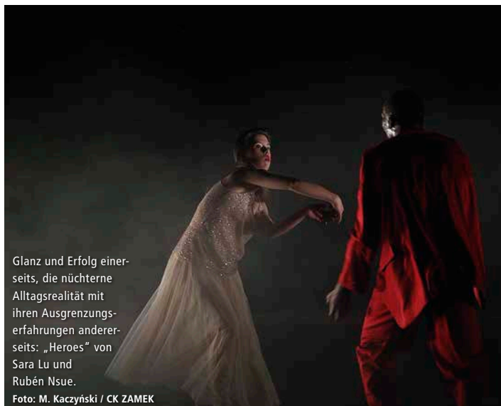
Glanz und Erfolg einerseits, die nüchterne Alltagsrealität mit ihren Ausgrenzungserfahrungen andererseits: „Heroes“ von Sara Lu und Rubén Nsue.