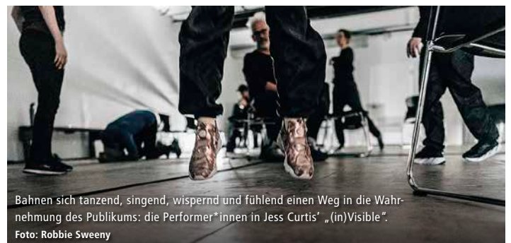
Bahnen sich tanzend, singend, wispernd und fühlend einen Weg in die Wahrnehmung des Publikums: die Performer*innen in Jess Curtis' „(in)Visible“.